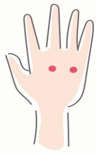
腰腿点 (ようたいてん)

腰の捻挫とも言われるぎっくり腰は、腰を支える靭帯や筋肉に急に負担がかかって断裂が起り、神経が刺激されることが原因で激痛が走る症状です。ぎっくり腰になると、強い痛みから当分立ち上がることでもできません。無理に身体を動かすとかえって症状を悪化させかねないため、3日は自宅で安静にし、その後病院に行くようにしましょう。下手に腰回りを触るのは厳禁です。ぎっくり腰の痛みには手の甲にある腰腿点(ようたいてん)というツボが有効です。中指の方に向かって押しながら、腰をゆっくり動かすと痛みが少しずつ和らいていきます。