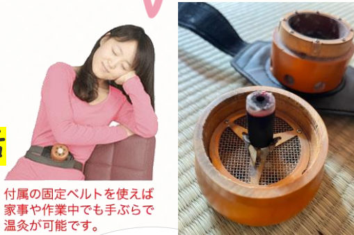
付属の固定ベルトを使えば家事や作業中でも手ぶらで温灸が可能です。